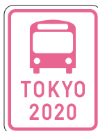
桜色の看板などが 目印です。